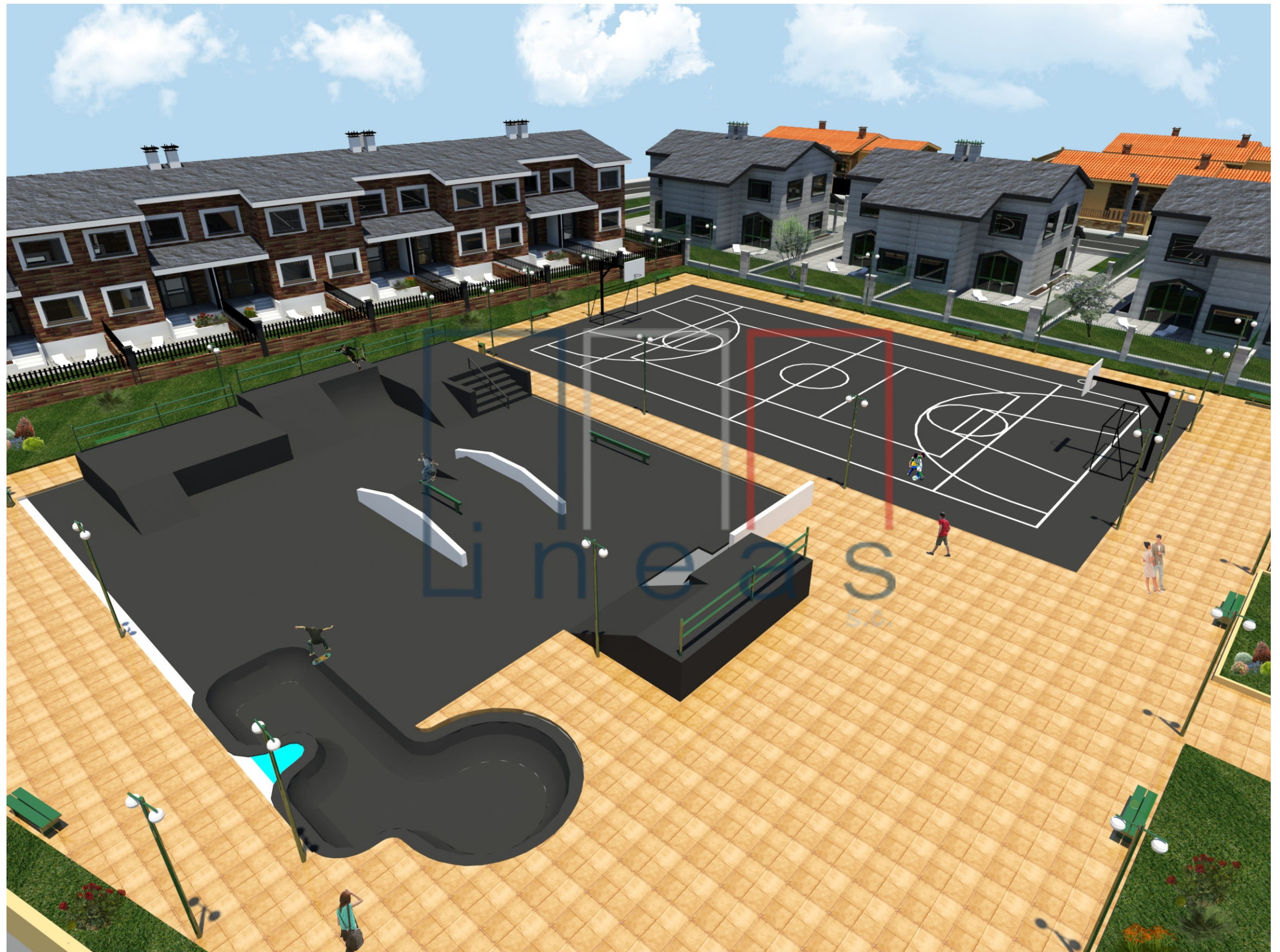
Perspectiva nº 11