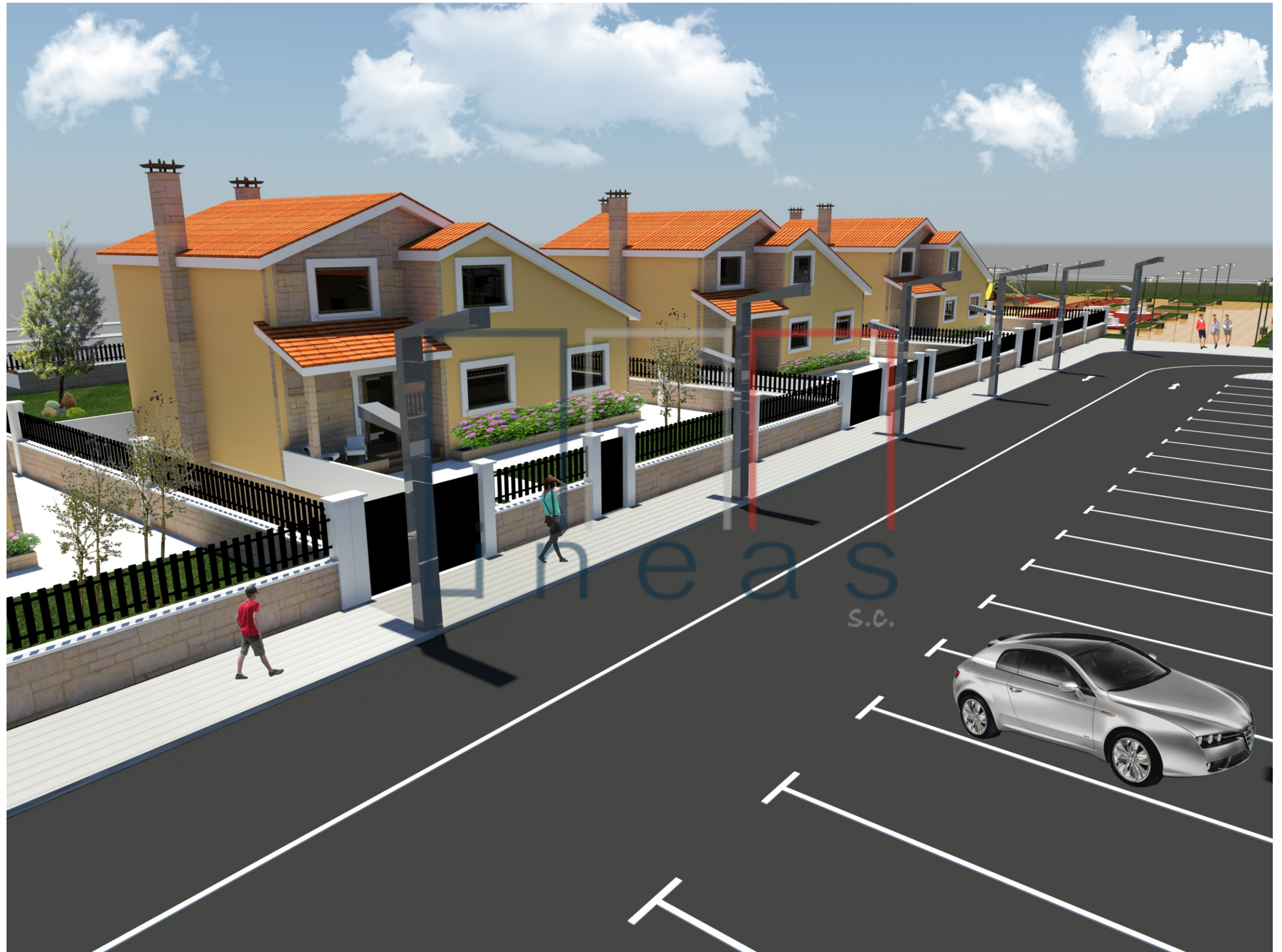
Perspectiva nº 6