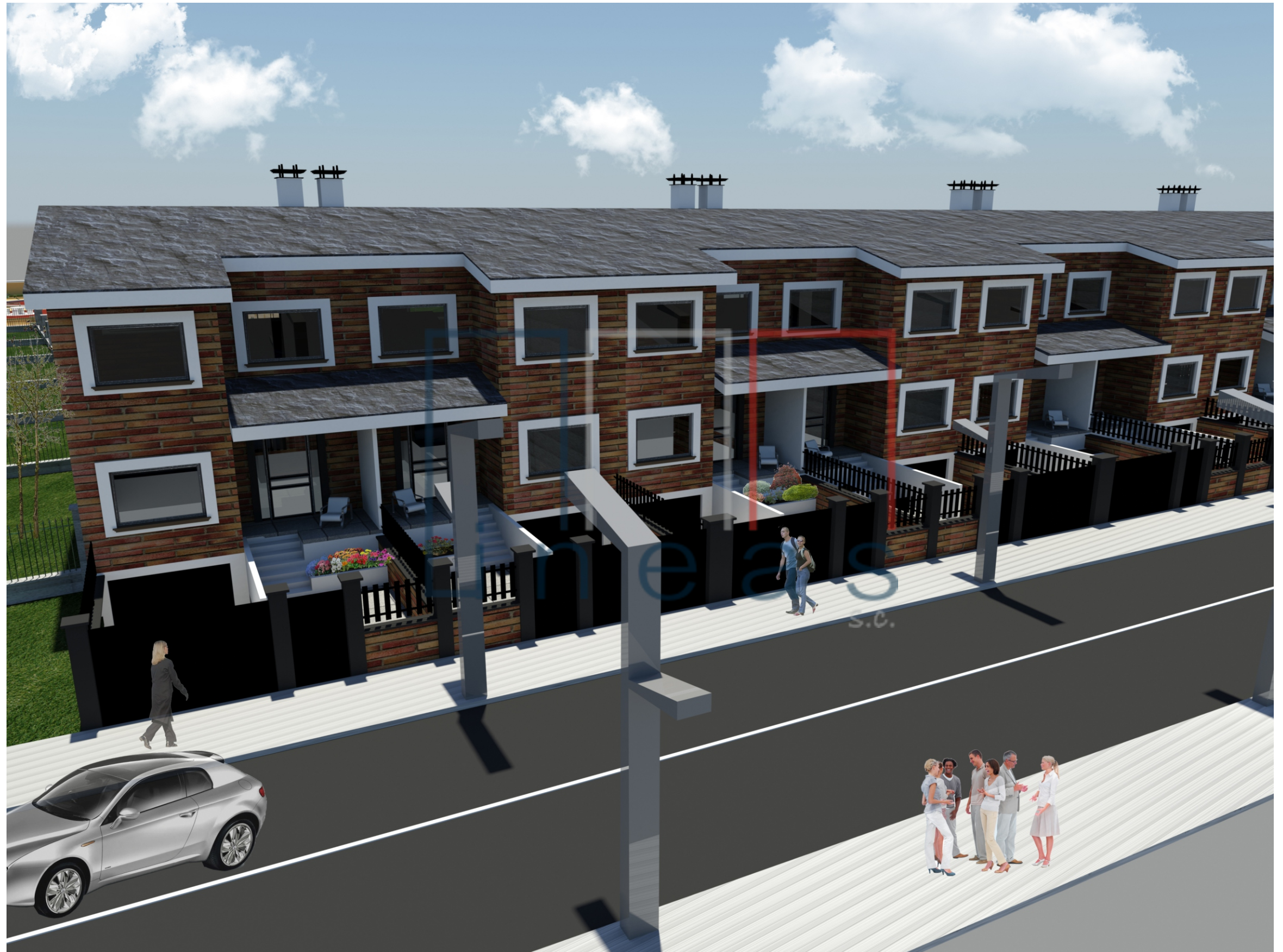
Perspectiva nº 9