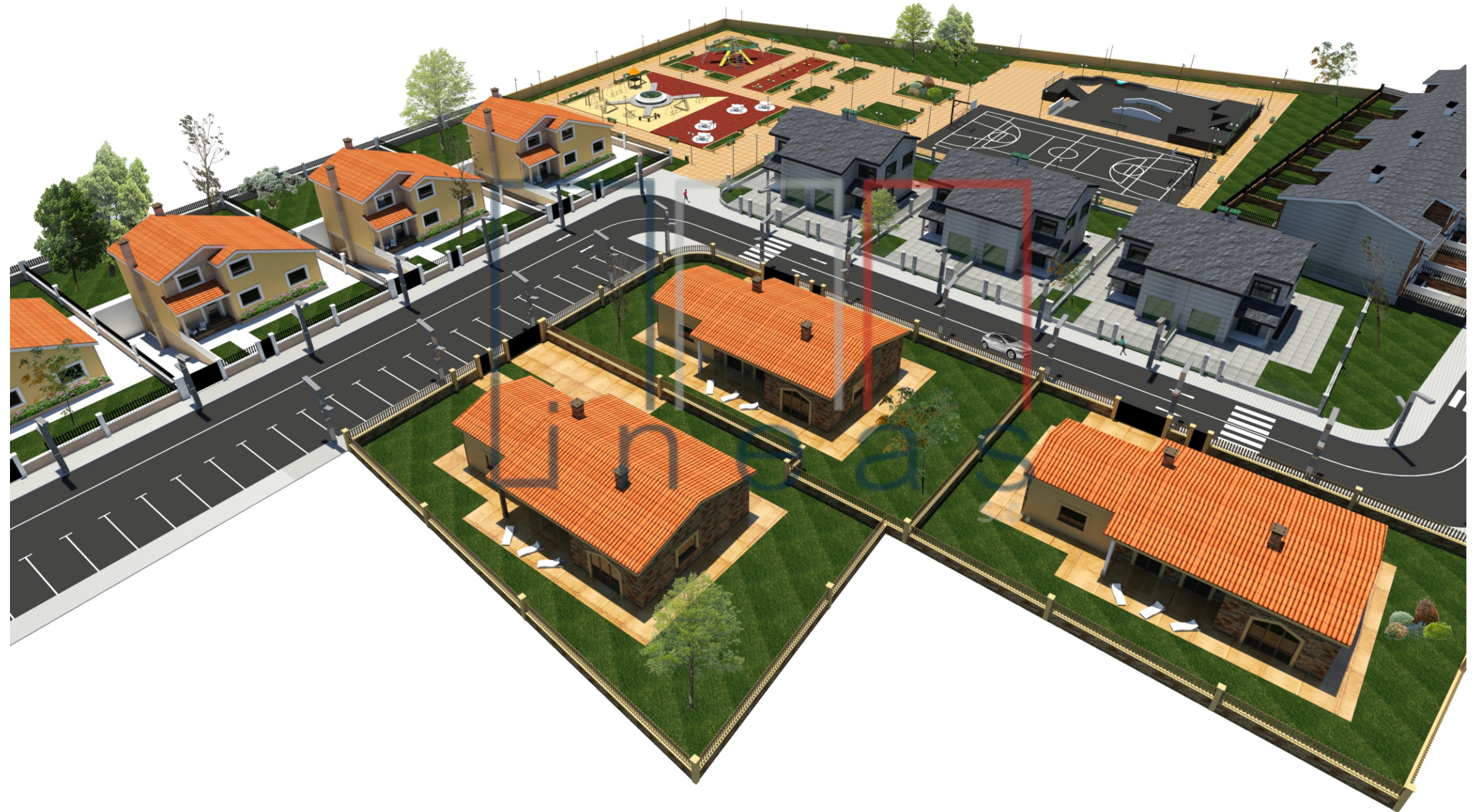
Perspectiva nº 2