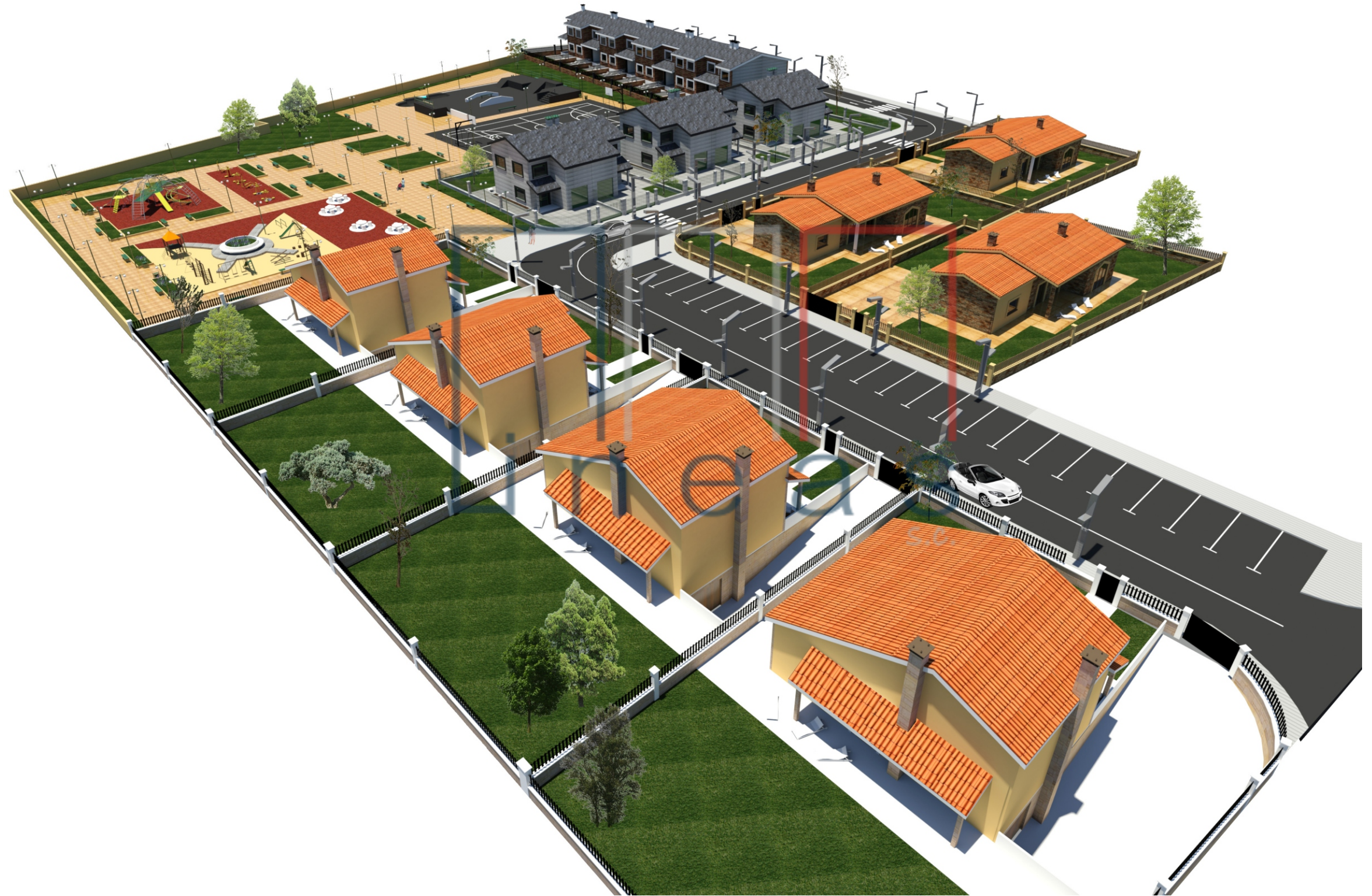
Perspectiva nº 5