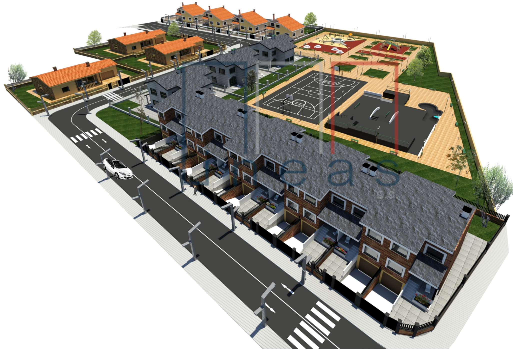
Perspectiva nº 3