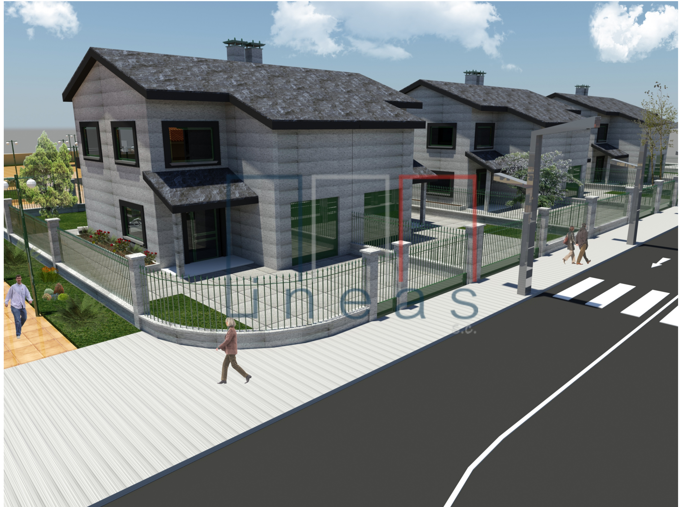
Perspectiva nº 8