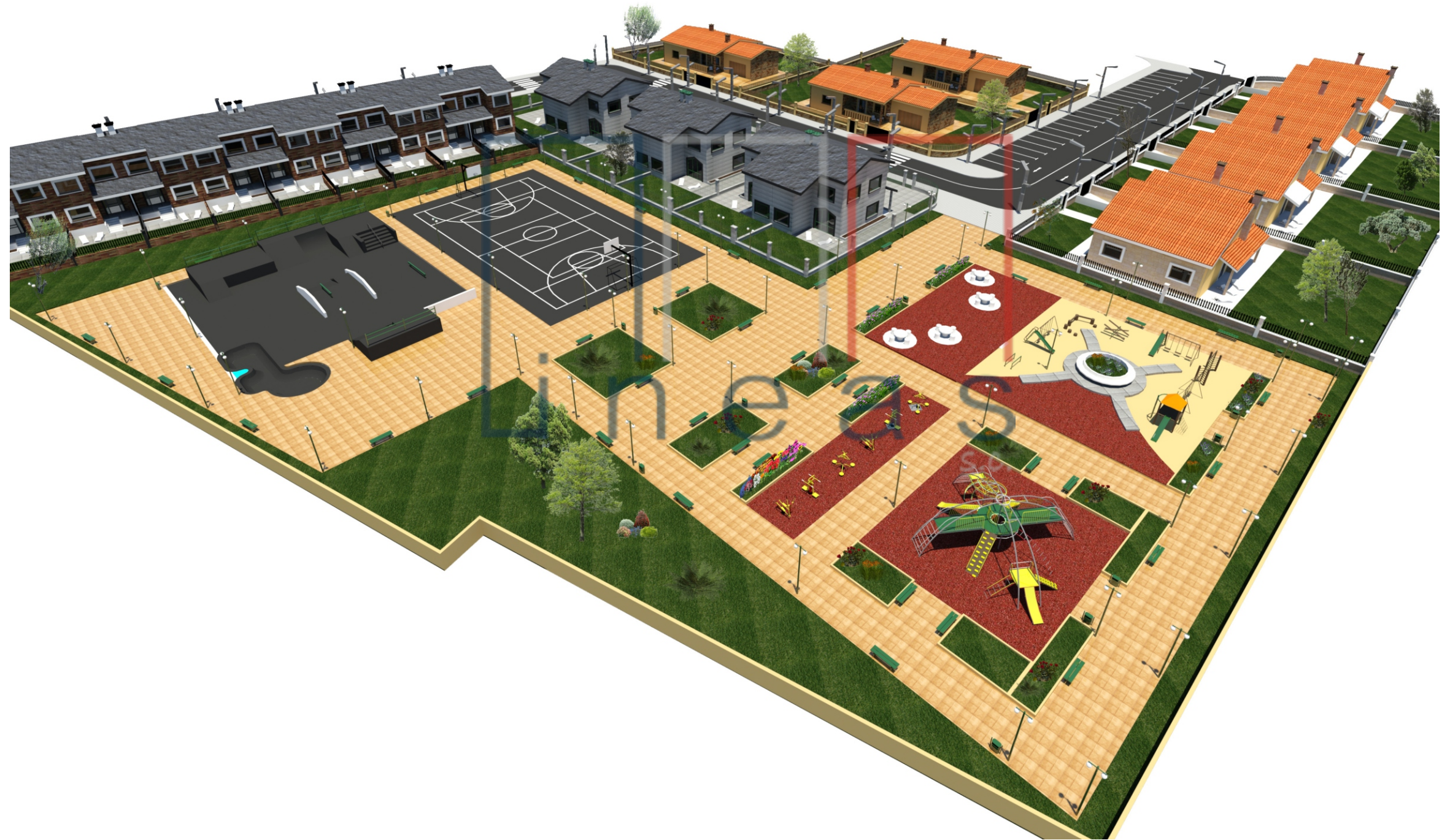
Perspectiva nº 4