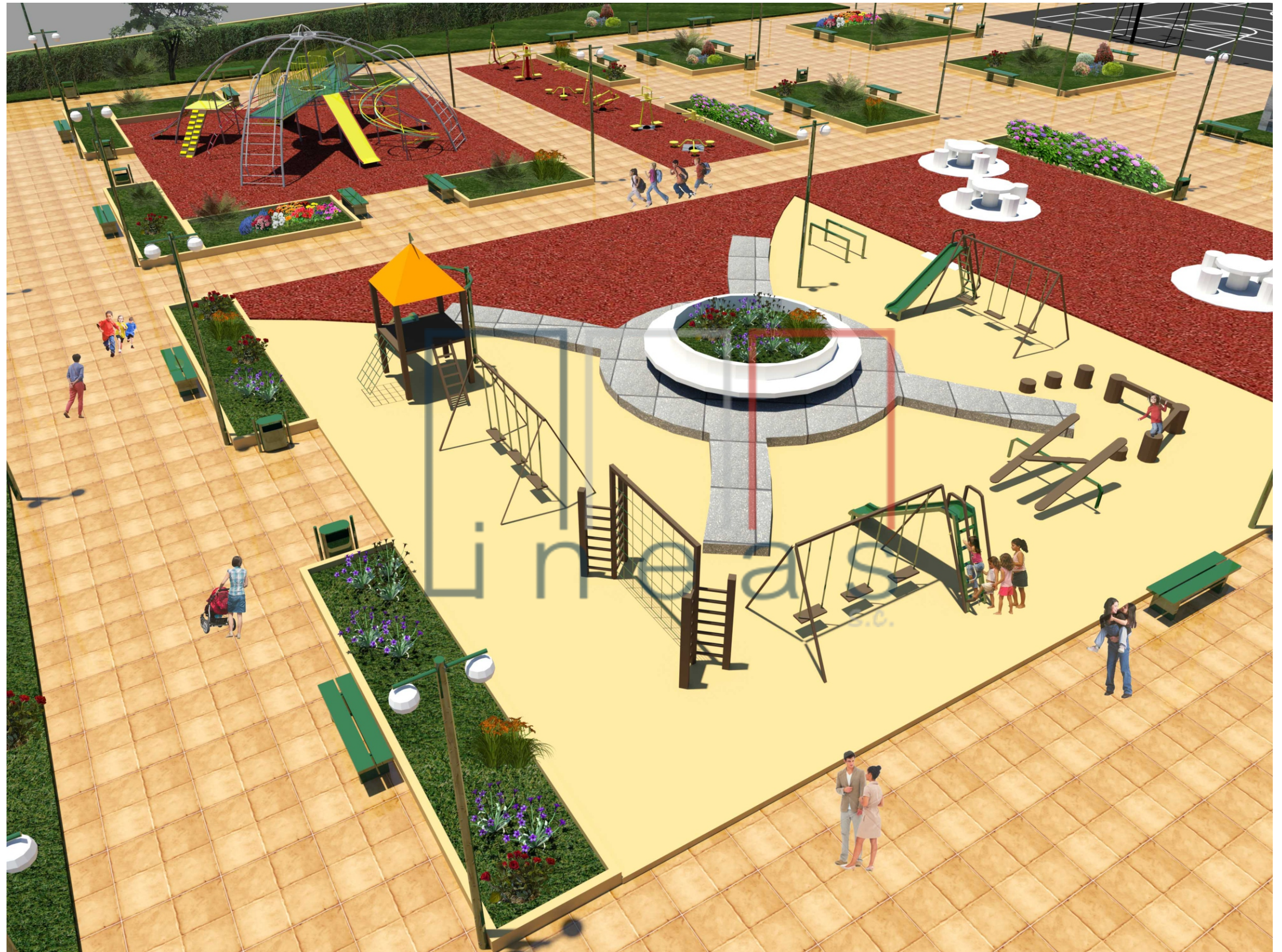
Perspectiva nº 10