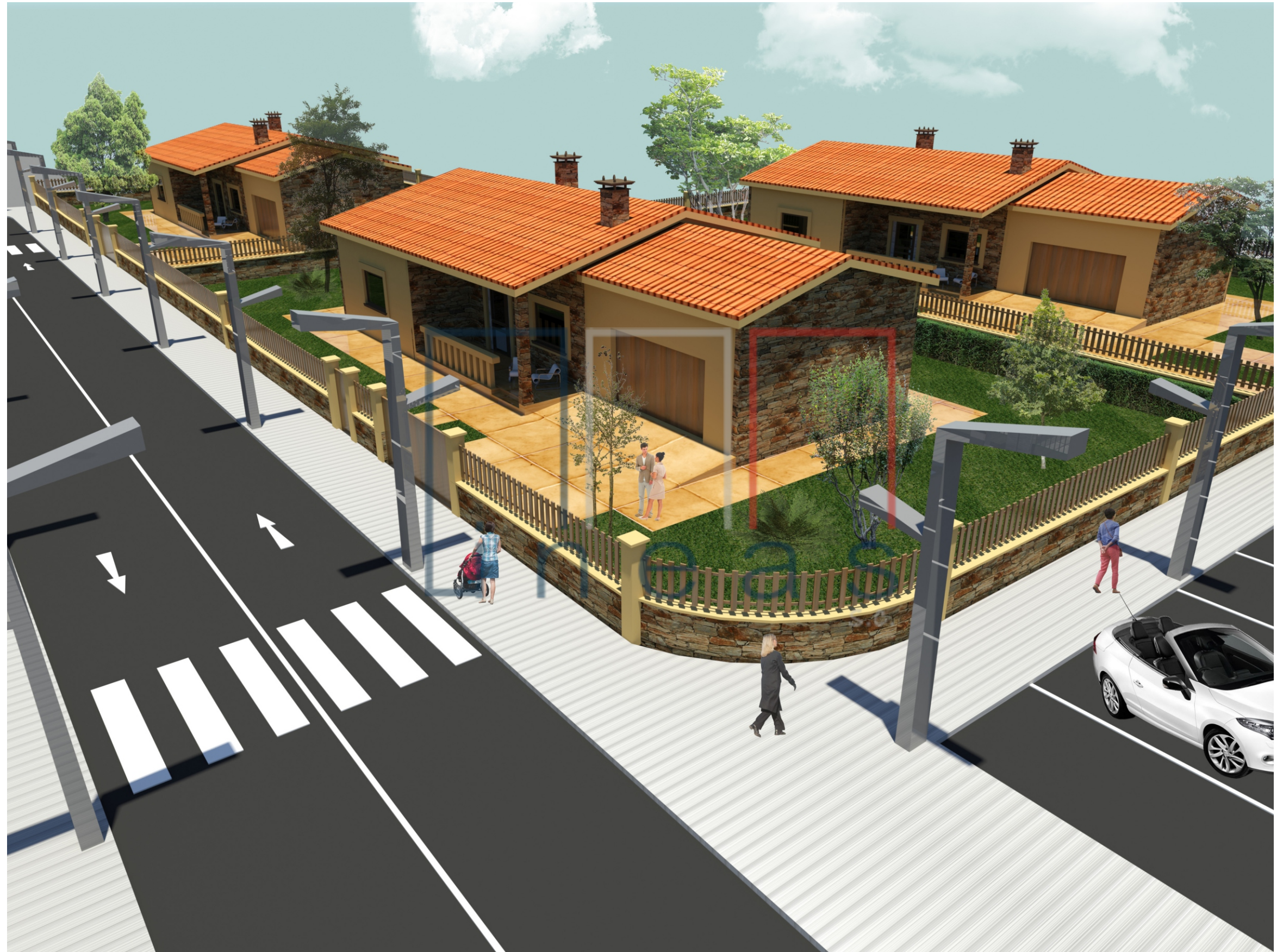
Perspectiva nº 7