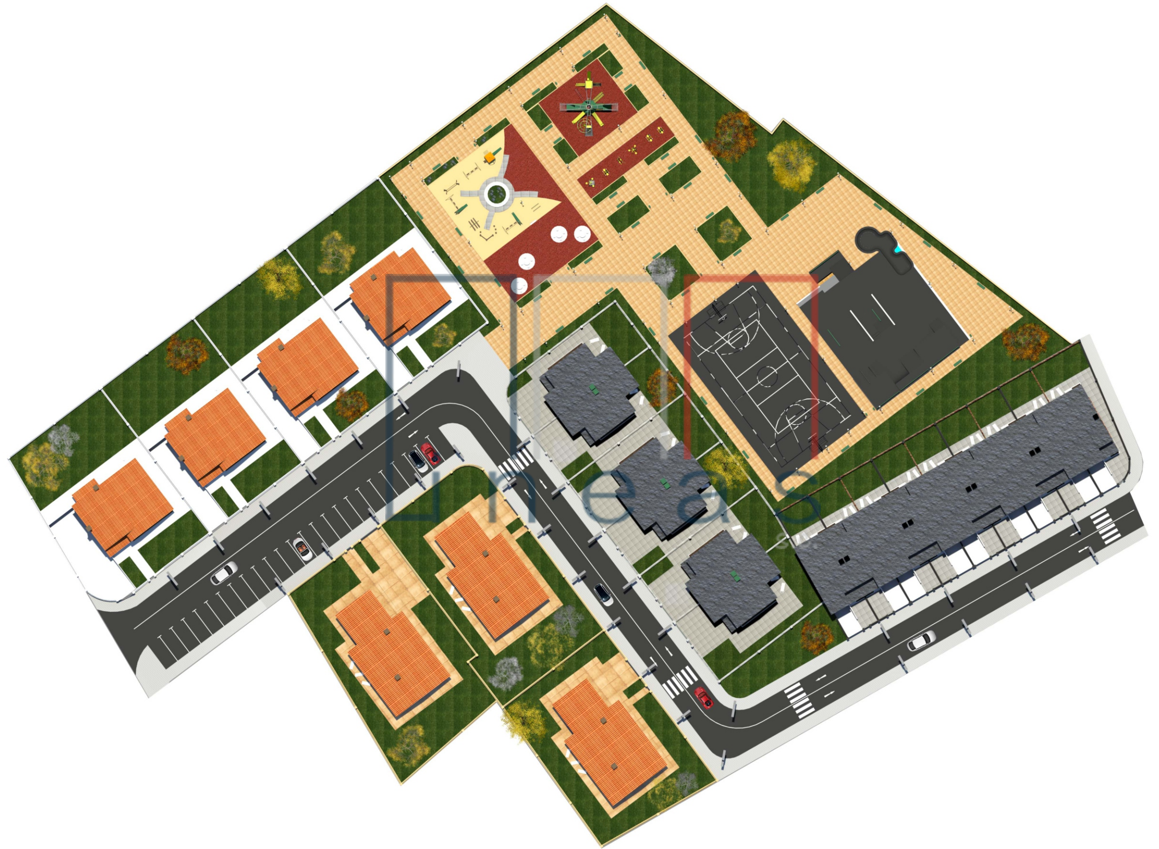
Perspectiva nº 1